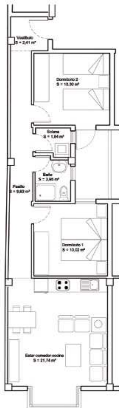
VIVIENDA 1º A