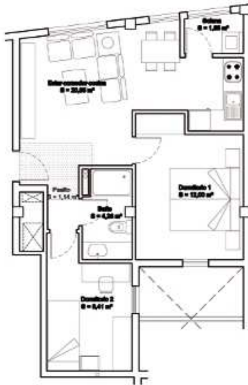
VIVIENDA 2º C