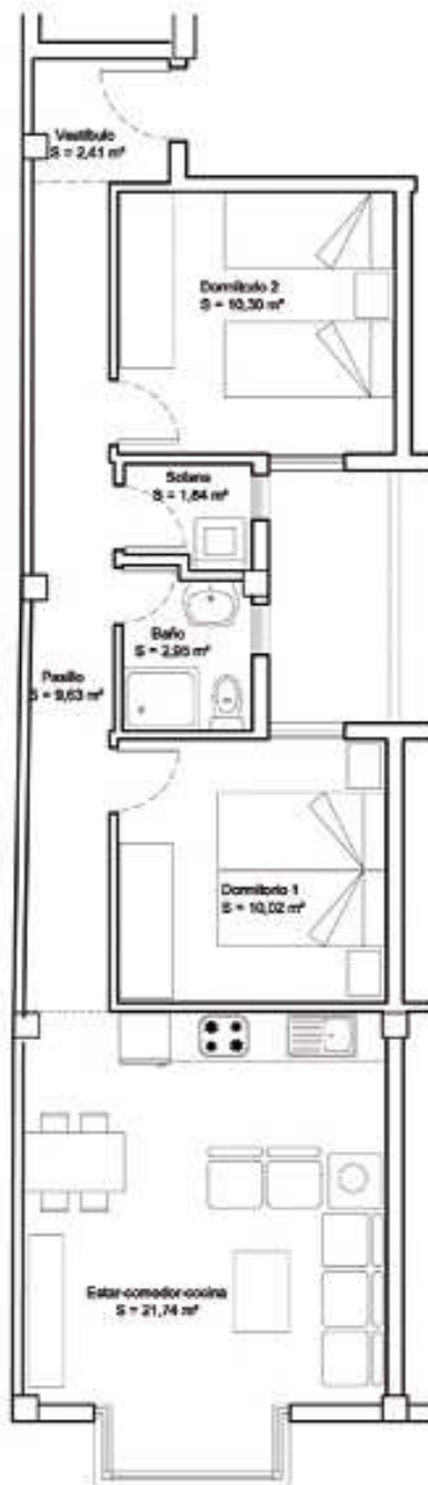
VIVIENDA 2º A